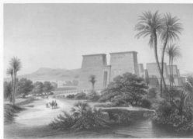
Grabado de Karnak mostrando sus pilonos.

El pilono o pilón , palabra proveniente del griego πυλών pylón 'puerta grande', 'portal', es una construcción con forma de pirámide truncada , a modo de gruesos muros, que, erigidos por pares, flanquean la entrada principal de los templos del Antiguo Egipto ; en el espacio dejado entre ambos se encuentra la puerta de acceso.